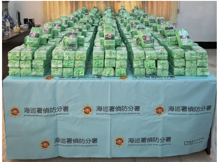
查獲以茶葉包包裝之第三毒品愷他命 (毛重共 946.67 公斤，淨重共 895 公斤)