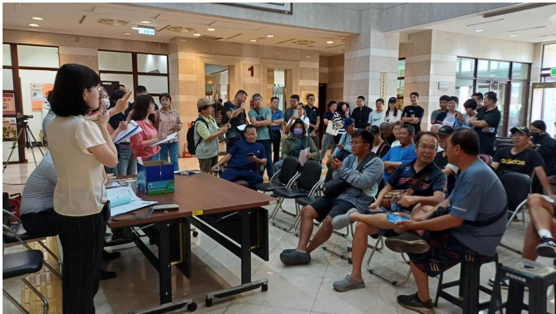
拍賣現場競標者眾，現場競標激烈。