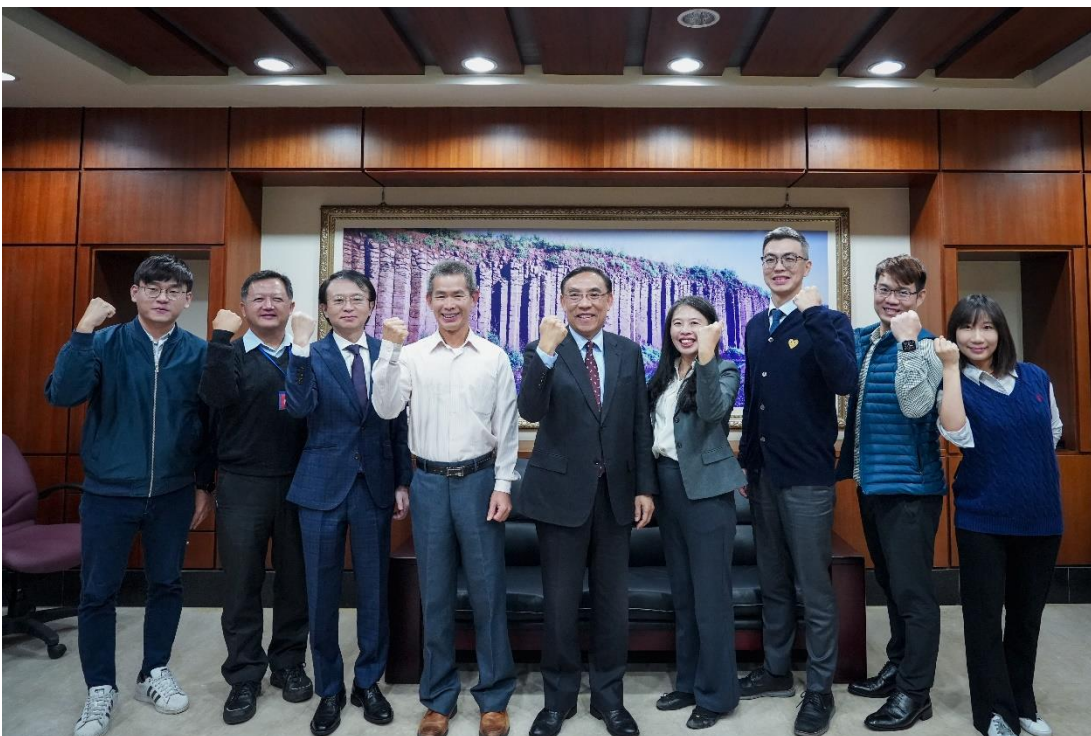
照片說明：部長與本署同仁合影