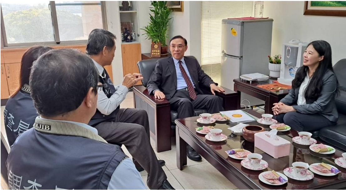
照片說明：部長至澎湖縣調查站聽取工作報告