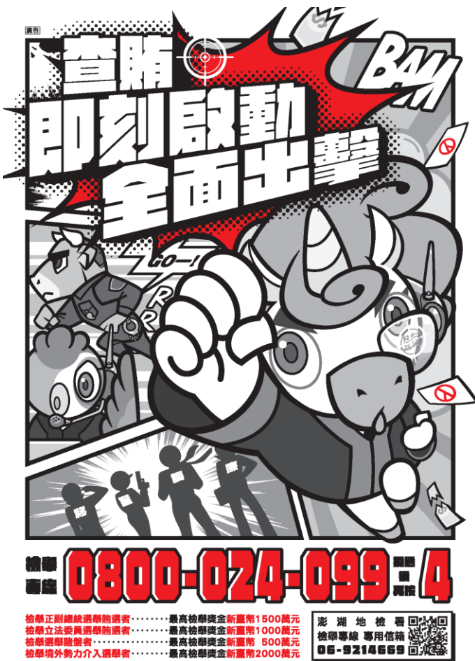
選舉公報之反賄選宣導圖卡